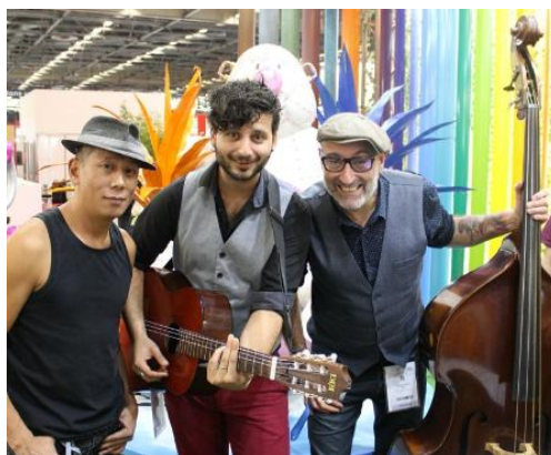
Chargé de l'animation et toujours prêt pour mettre le feu « les Fauss'airs »

Même si la fréquentation du salon avec ses 284 000 visiteurs n'était pas la plus forte affluence que BATIMAT ait connu, nous avons pu, grâce à notre positionnement et grâce à l'ambiance de notre stand, toucher clients et prospects et mettre en avant tout le savoir faire et les spécialités du groupe TMN Industries et de ses partenaires.